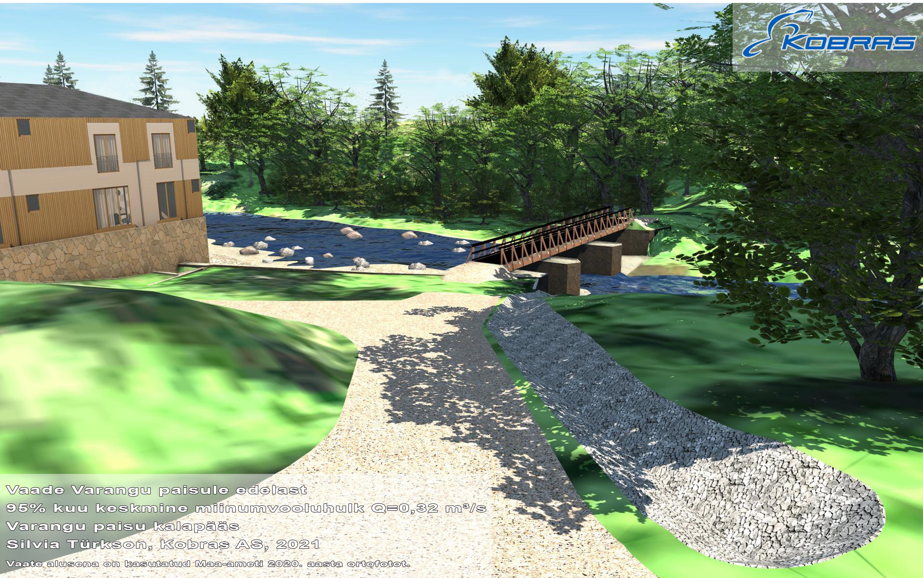
Vaade Varangu paisule edelast 95% kuu keskmine miinumvooluhulk Q=0,32 \text{ m}^3/\text{s} Varangu paisu kalapääs Silvia Türkson, Kobras AS, 2021 Vaate alusena on kasutatud Maa-ameti 2020. aasta ortofotot.